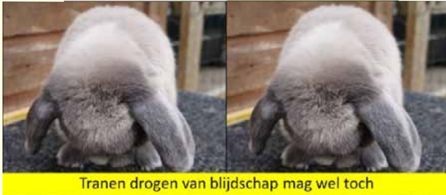
Tranen drogen van blijdschap mag wel toch

yes yes yes !!!!!!! Wij mogen gaan schitteren op een show want wij hebben onze shots gehad. Wij gaan onze baas heel blij maken met alles wat blinkt.