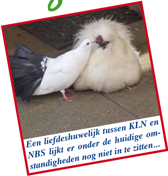
Een liefdeshuwelijk tussen KLN en NBS lijkt er onder de huidige omstandigheden nog niet in te zitten...

Een kort 'to do'-lijstje voor het HB met items in willekeurige volgorde. Het HB kan/moet: