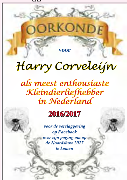
Een speciale oorkonde.