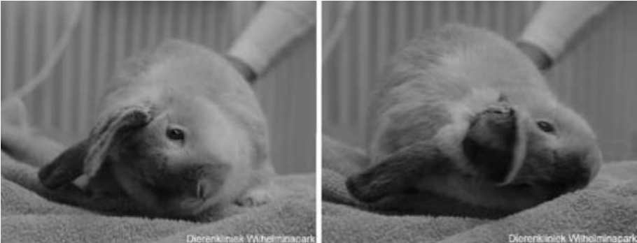
konijn met Torticollis