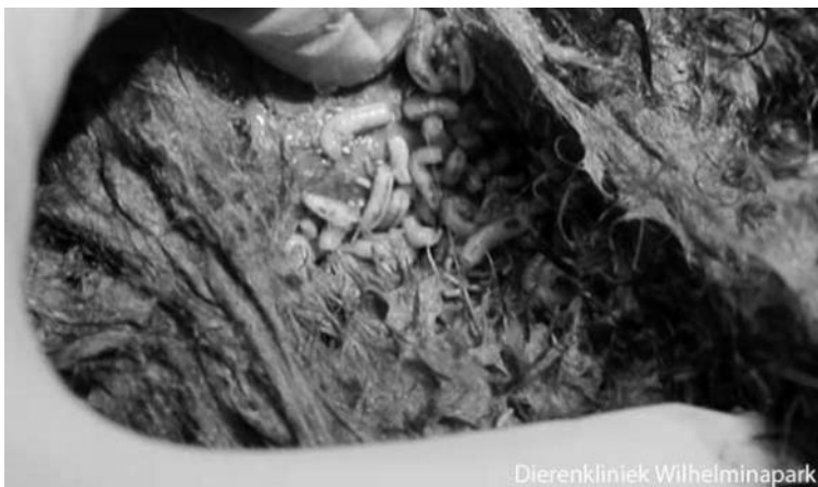
Onder de vieze vacht krielen de maden